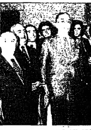
ثناء زيارة السفارة اللبنانية في القاهرة

من هنا يبدأ لبنان تلتفت من صلب التوقع ما يلي: قرأت مقالك الصادر بتاريخ ٨ الجاري في الدعوة الى انشاء احزاب وطنية ترتفع بالتفكير اللبناني عن الاعتراف الطائفية التي كانت حتى اليوم سبب كل بلائنا.